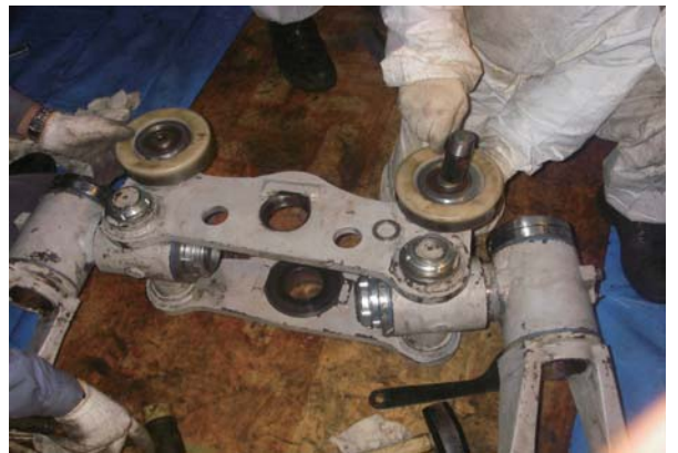
握索機組み立て作業