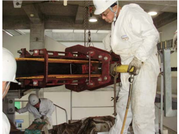
原動滑車ゴムライナー交換作業