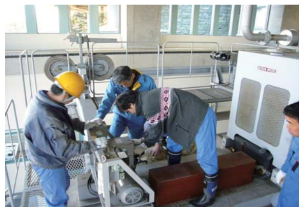
予備原動機操作手順訓練