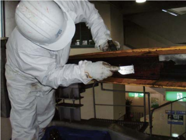
原動滑車ゴムライナー交換作業

また、原動滑車磁粉探傷検査を実施し、溶接接合部に亀裂等の欠陥が無いことを確認しております。