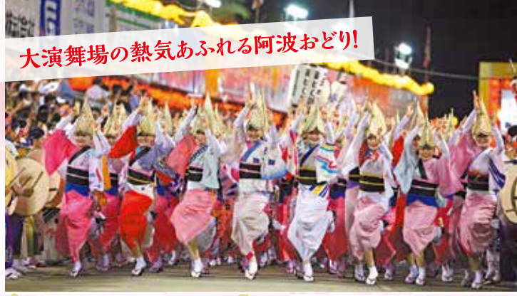
大演舞場の熱気あふれる阿波おどり!